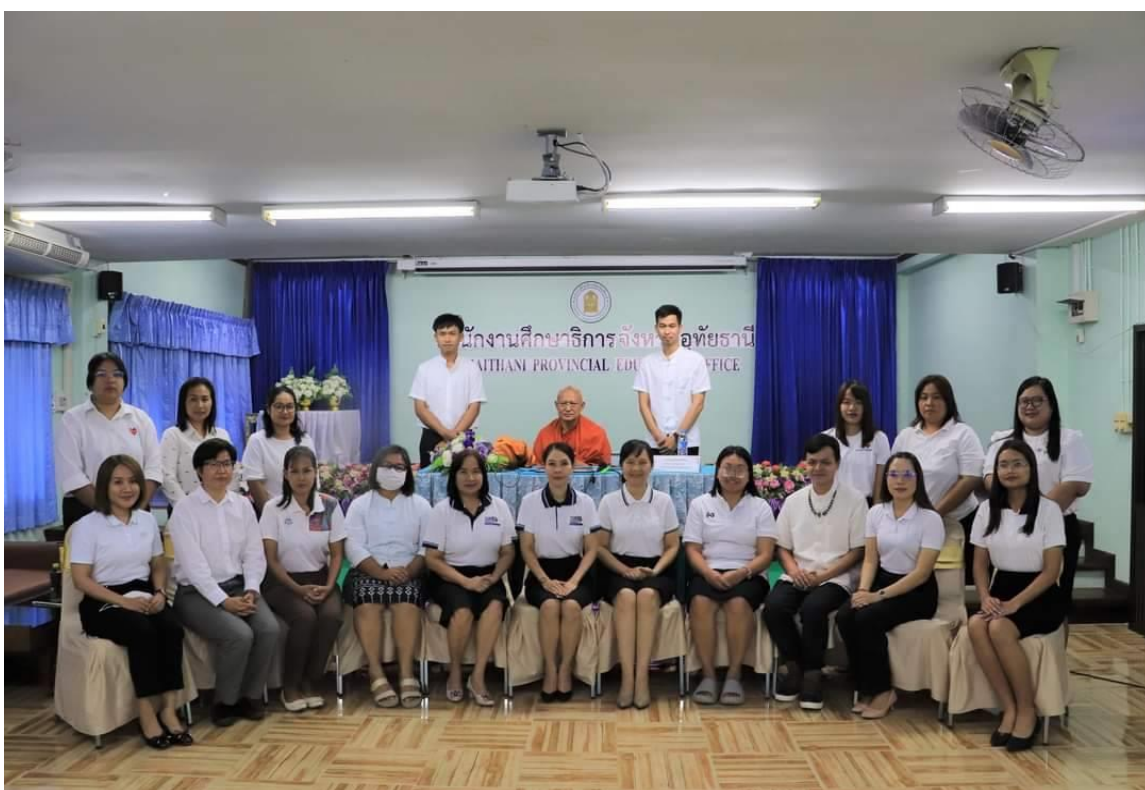
ภาพที่ ๔ - ๖ : กิจกรรมจัดอบรมให้ความรู้เกี่ยวกับการเสริมสร้างคุณธรรม จริยธรรม ป้องกันและต่อต้านการทุจริต