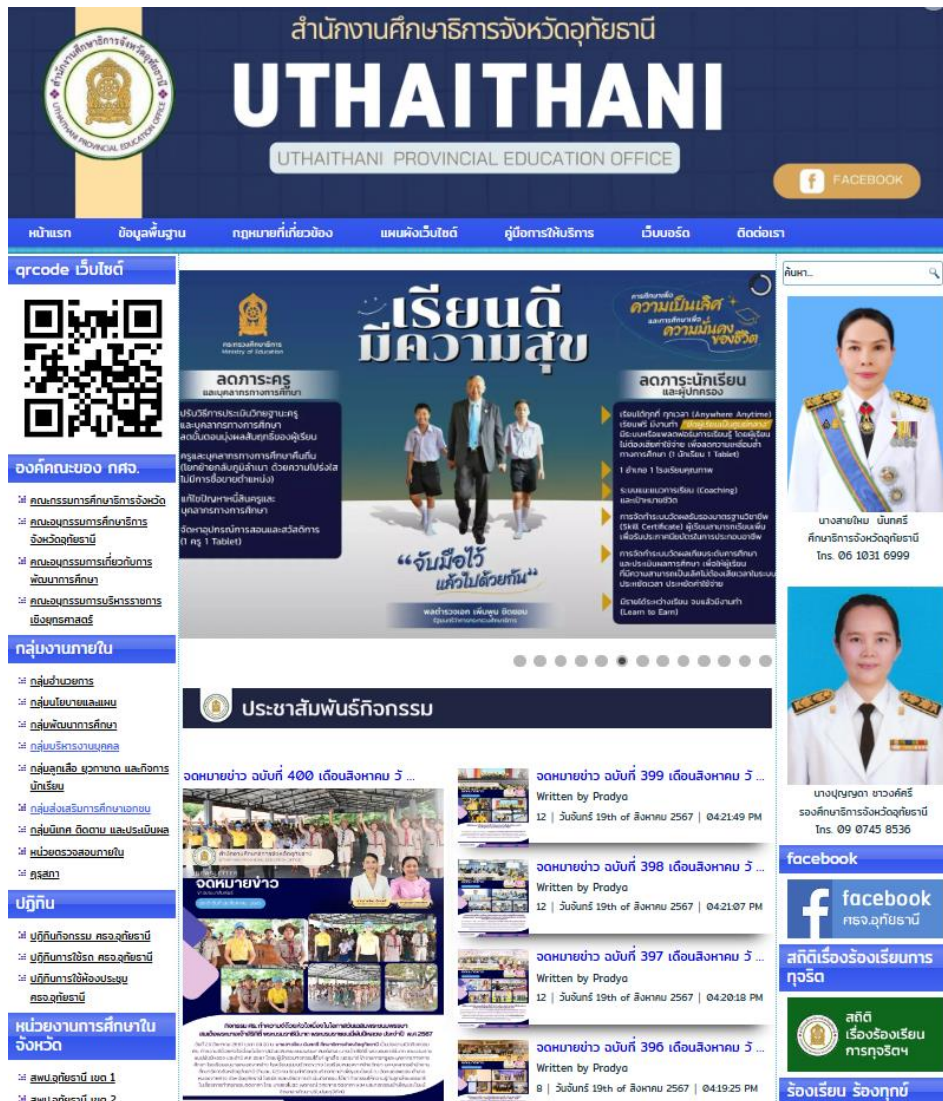
ภาพที่ ๘ : ช่องทางติดต่อสื่อสารกับผู้รับบริการ

สำนักงานศึกษาธิการจังหวัดอุทัยธานี ได้แสดงช่องทางที่ประชาชนหรือผู้ยื่นคำขอรับใบอนุญาตจัดตั้งโรงเรียนสามารถติดต่อสอบถามหรือแสดงความคิดเห็นต่อการดำเนินงานตามอำนาจหน้าที่หรือภารกิจของหน่วยงานผ่านช่องทางออนไลน์ ( https://www.uthaipeo.go.th - Website สำนักงาน)